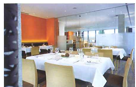
L'AREA DEL RISTORANTE