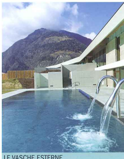
LE VASCHE ESTERNE