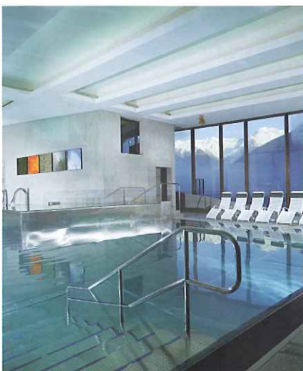
VASCA INDOOR CON VISTA PANORAMICA

A soli 15' min da Brunico. Oppure 45' d'auto da Bressanone.